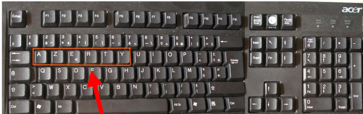
Clavier français AZERTY (Autre clavier query)